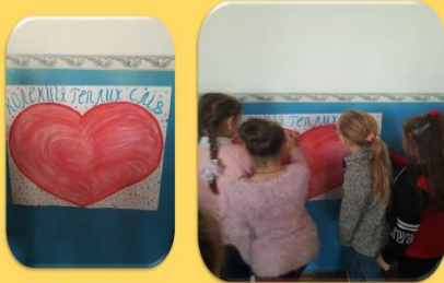
ПЛАКАТ «КОЛЕКЦІЯ ТЕПЛИХ СЛІВ»