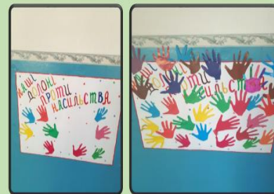
АКЦІЯ «НАШІ ДОЛОНЬКИ ПРОТИ НАСИЛЬСТВА»