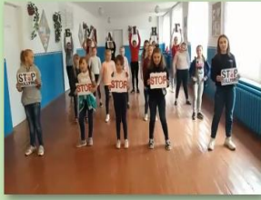
Флешмоб «Школа без булінгу, сім'я проти насильства – 365»