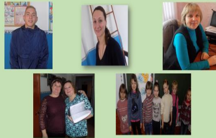
«ПОДІЛЯТЬСЯ ПОСИМШОЮ СВОЄЮ»