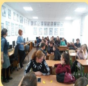
ПЕРЕГЛЯД ВІДЕО ДО ВСЕСВІТНЬОГО ДНЯ БОРОТЬБИ ЗІ СНІДОМ