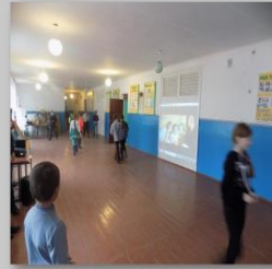
ПЕРЕГЛЯД СОЦІАЛЬНОЇ РЕКЛАМИ «СТОП НАСИЛЬСТВУ»